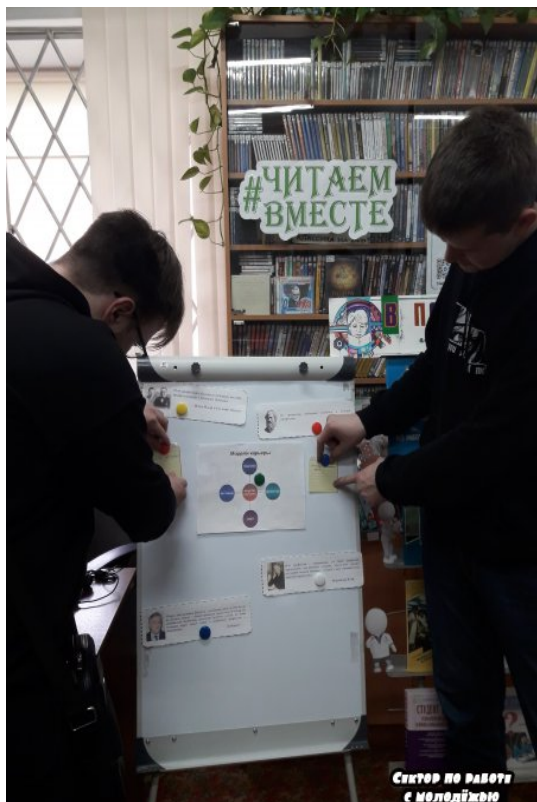
Сектор по работе с молодёжью