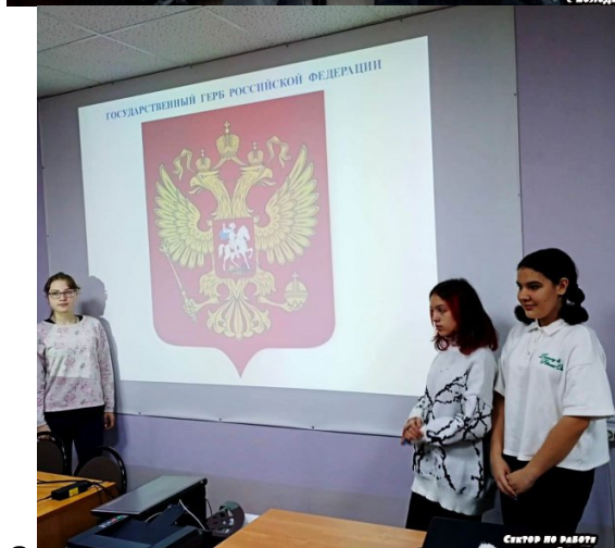
Внеклассная работа по правовому образованию в форме игры «Я – гражданин России»