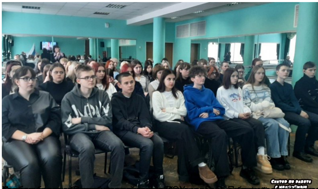
Сектор по работе с молодежью